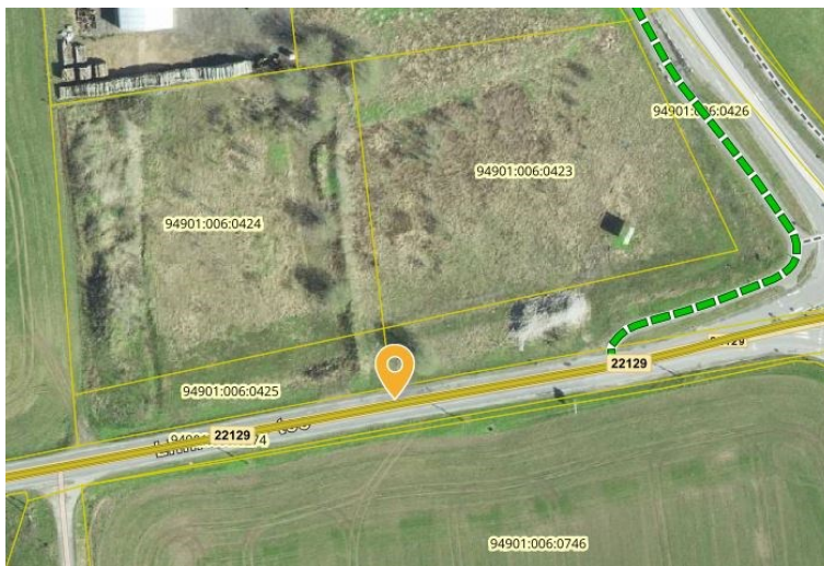
Joonis 1. Riigitee nr 22129 km 0,617